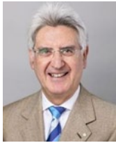
2025～26 年度 国際ロータリー会長 フランチェスコ・アレツツォ