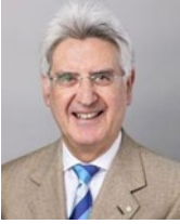
2025～26 年度 国際ロータリー会長 フランチェスコ・アレツツォ