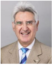
2025～26 年度 国際ロータリー会長 フランチェスコ・アレツツォ