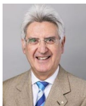
2025～26 年度 国際ロータリー会長 フランチェスコ・アレツツォ