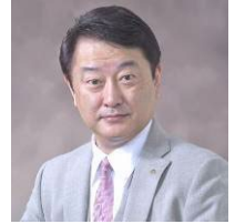
2023~24 年度 新潟ロータリークラブ会長