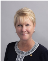
2022-23 年度 国際ロータリー会長 ジェニファー・ジョーンズ