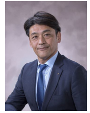
2022~23 年度 新潟ロータリークラブ会長