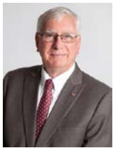
2017-18年度 国際ロータリー会長 イアン・ライズリー