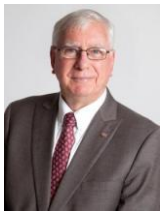
2017-18年度 国際ロータリー会長 イアン・ライズリー