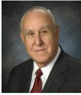
2016-17年度 国際ロータリー会長 ジョン F. ジャーム