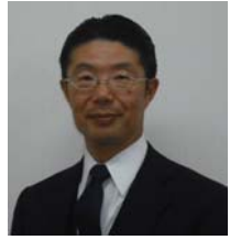
2014～15 年度 新潟ロータリークラブ会長