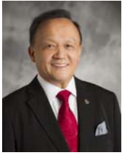
2014～15 年度 国際ロータリー会長