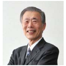
2013～14 年度 新潟ロータリー会長