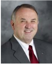
2013～14 年度 国際ロータリー会長