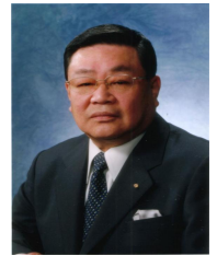
2007～08 年度 新潟ロータリー会長