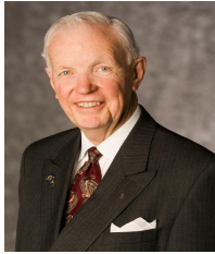
2007～08 年度 国際ロータリー会長